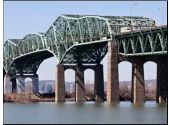
Le pont Champlain est le pont le plus achalandé au pays.

« Nous n'aurons certainement pas une autre fois cette occasion dans notre vie, l'occasion de créer un symbole si important comblant nos besoins d'infrastructure, a déclaré M. Léopold, mercredi, dans le cadre du Forum sur le nouveau pont Champlain organisé par l'Institut pour le partenariat public privé (IPPP). Nous devons également comprendre que ce sera un pont qui affectera positivement le bien-être économique de chaque personne vivant dans la région de Montréal pendant le siècle suivant et plus encore. »